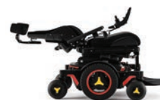
Inclinaison de dossier