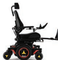
Relève-jambes réglables en angle