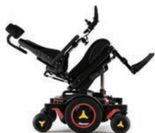
Bascule d'assise arrière