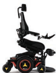
Bascule d'assise avant/proclive